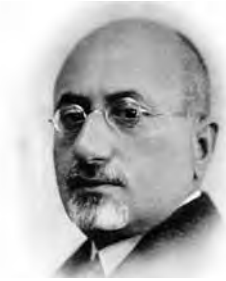
Հայկական Կարմիր խաչի ղեկավարությունը հիմնադրվել է 1920թ-ի մարտի 19-ին Սպանդարատ Կամսարականի կողմից

Նվազեցնել ազգաբնակչության խոցելիությունը մարդասիրության ուժի մոբիլիզացմամբ: Նախապատրաստվել դիմակայելու այն իրավիճակներին, որոնք կարող են ազգաբնակչության խոցելիության պատճառ դառնալ: Ցուցաբերել անրաժեշտ օգնություն՝ սատարելով սոցիալ-տնտեսական ծանր պայմաններում գտնվող մարդկանց: